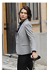
NEOBLU MARCEL WOMEN