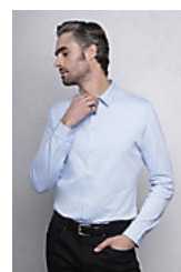
NEOBLU BALTHAZAR MEN