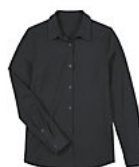
NEOBLU BALTHAZAR WOMEN