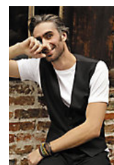
NEOBLU LUCAS MEN 03184