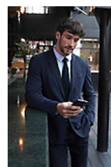
NEOBLU MARCEL MEN