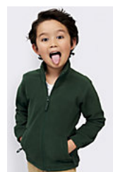
SOL'S NORTH KIDS 00589