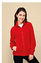
SOL'S NORTH WOMEN 54500