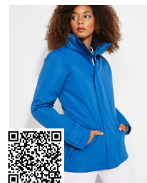
EUROPA WOMAN PK5078