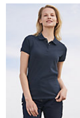
SOL'S PASSION 11338