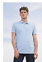
SOL'S SUMMER II 11342