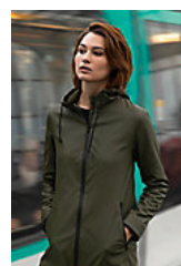
NEOBLU ANTOINE WOMEN 03175