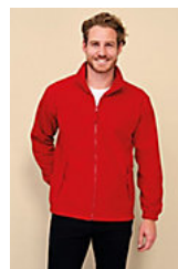
SOL'S NORTH 55000