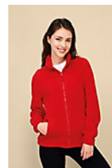
SOL'S NORTH WOMEN 54500